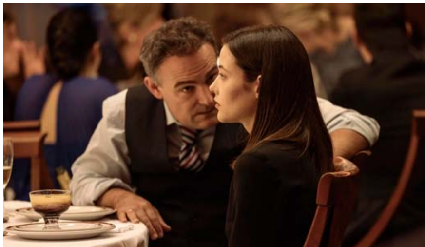
Un prédateur et sa proie qui va ensuite se rebiffer, dans « Soy Nevenka », projeté le 11 octobre à l'Artplexe, en présence de sa réalisatrice Iciar Bollain.

Illustration suprême avec un « hommage » à Iciar Bollain, marraine de la manifestation, qui y dispensera une « masterclass ». Cinq films de cette réalisatrice majeure de la péninsule ibérique seront également projetés, parmi lesquels Te doy mis ojos