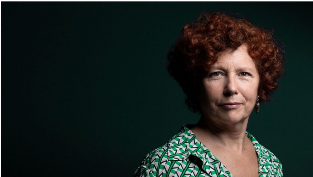
Icíar Bollaín

« Parallèlement, a commencé à apparaître une cinématographie réalisée par des femmes qui ont commencé à raconter une autre histoire, différente. » On ne s'étonnera donc pas que le festival ait choisi de mettre à l'honneur, l'actrice et cinéaste Icíar Bollaín, qui a ouvert la voie à une nouvelle génération de femmes cinéastes. Figure majeure du cinéma espagnol contemporain, Icíar Bollaín a commencé dans le cinéma en tant qu'actrice dans le magnifique El Sur (1983) de Victor Erice (vendredi 12 octobre à 17h 30 aux Variétés) et poursuit sa carrière avec 27 films à son actif.